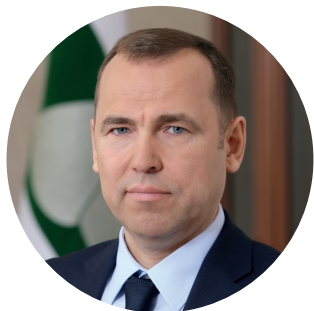
Губернатор Курганской области Шумков В. М.

Мы ценим серьёзных партнёров. Приглашаем вас убедиться в том, что вести дела на территории Курганской области выгодно и приятно.